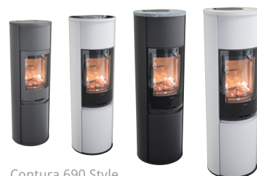
Contura 690 Style

Vi stiller høje kvalitetskrav i alle led, og brændeovnene kvalitetskontrolleres før de forlader fabrikken i Markaryd. Vores brændeovne har effektiv forbrænding, som gør, at du kan fyre med ren samvittighed på en måde, der er god for både miljøet og din pengepung. Velkommen!